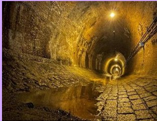
湊川隧道/イメージ

かつて神戸の中心地を流れていた旧湊川。神戸の発展のため、川の付け替え工事が明治時代に行われ、その際に造られた日本初の河川トンネル「湊川隧道」は、当時世界最大規模と評される。現在は国登録有形文化財に登録。煉瓦造りの巨大地下空間は必見！