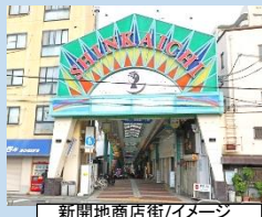
新開地商店街/イメージ

「東の浅草、西の新開地」と呼ばれたまちのお話を聞きながら、「新開地商店街」を散策！