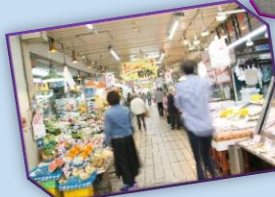
マルシン市場/イメージ