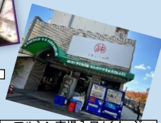
マルシン市場入口/イメージ