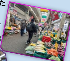
東山商店街/イメージ

湊川隧道や川の付け替え工事によって誕生した“湊川新開地のまち”は昭和レトロ感あふれるディープスポット！ここでしか味わえないご当地グルメを試食しながら、ガイドと共に散策！(出発日より、ご当地グルメの内容は変更となる場合があります。)