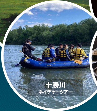
十勝川 ネイチャーツアー