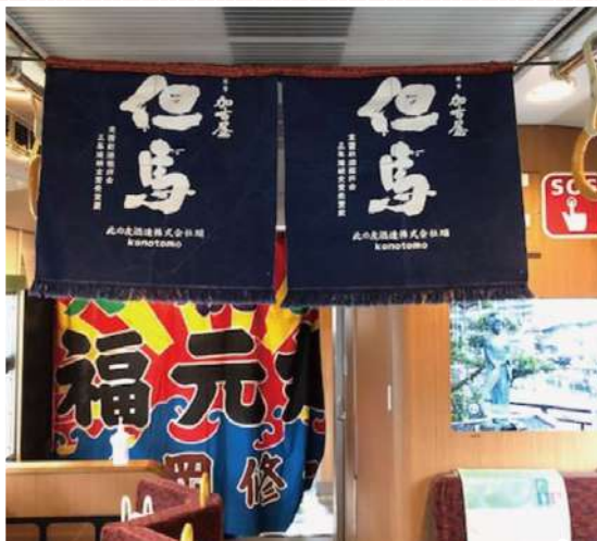
車内は大漁旗などで飾りつけ(イメージ)