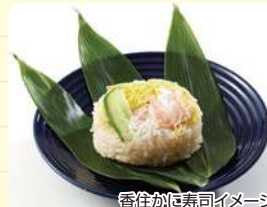
香住かに寿司イメージ