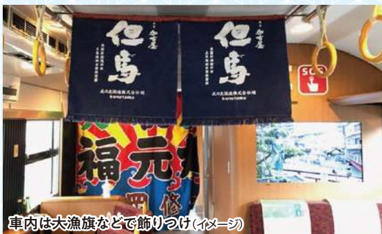
車内は大漁旗などで飾りつけ(イメージ)