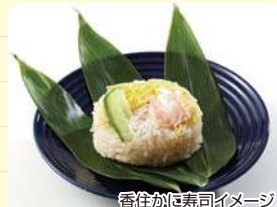
香住かに寿司イメージ