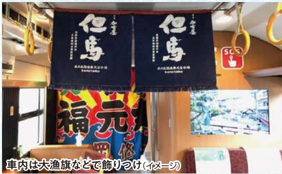
車内は大漁旗などで飾りつけ(イメージ)