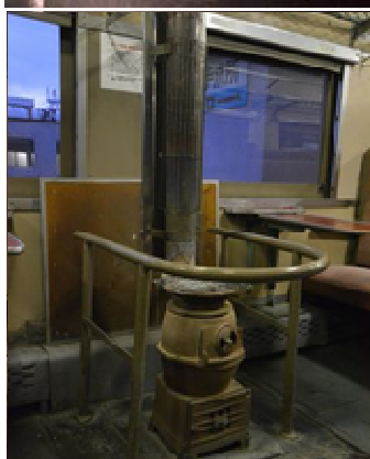
ストーブ列車イメージ/当日は気動車が客車をけん引する場合があります。客車は1両となります。