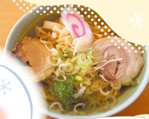
〈佐野市〉佐野らーめん