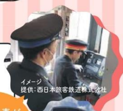
イメージ

日々の列車のメンテナンスを行っている車両所の中の線路を用いて、本物の列車の運転を体験できます。体験の際には、実際の運転士さんが横について操縦を教えてください。