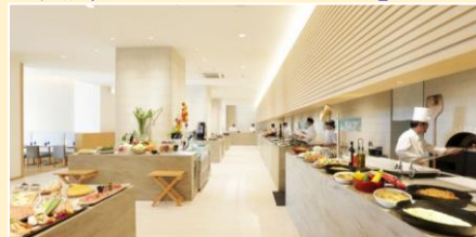
「by the ocean」/イメージ

「by the ocean」レストランにて、焼きたてピザ などのライブコーナーも備えた、和洋多彩な料理 が並び、人気の「シラハマビュッフェ」をどうぞ。