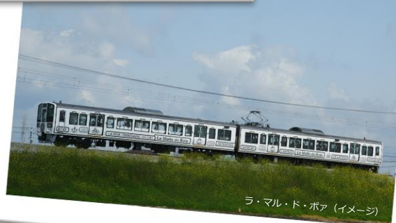
ラ・マル・ド・ボア (イメーシ)

せとうちエリアの観光列車「ラ・マル・ド・ボア」に乗りして ユネスコ無形文化遺産に登録された白石踊と、日本遺産の一部である巨 石の下に建てられた開龍寺を学びながら楽しむ日帰りツアーです。