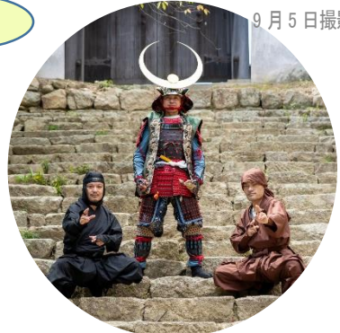
「岡山おもてなし武將隊」 「岡山忍者隊葉隠」