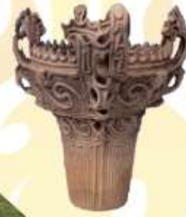
火焰型土器 (イメージ)