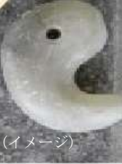
勾玉作り体験 (イメージ)

人と自然が共存共生し、1万年もの間、豊かな時代が続いた 縄文時代 。人々は、日々狩猟をし、土器を作り生活を営んでいました。まさに 究極のサステナビリティ ！新潟で多く発見される火焰型土器は、芸術性の高さも非常に評価されています。縄文人の衣食住を目で見て触れて、実際に体験してみませんか？