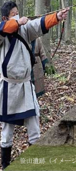
笹山遺跡 (イメージ)