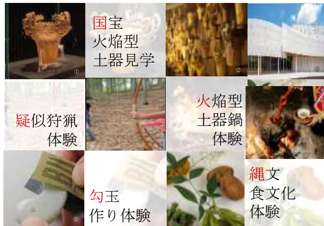
① 火焰型土器 (イメージ) 十日町市博物館所蔵 (提供) ② 新潟県立歴史博物館 (イメージ) ③ 十日町市博物館 (イメージ) 十日町市博物館所蔵 (提供) ④ 狩猟体験 (イメージ) ⑤ 火焰型土器鍋 (イメージ) (一社) 十日町市観光協会 ⑥ 勾玉作り体験 (イメージ) ⑦ 夕食メニュー例(イメージ)食材の仕入れによって変更する場合がございます。