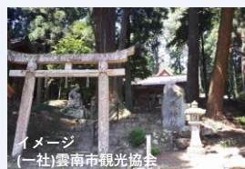
イメージ (一社)雲南市観光協会 イナタヒメの両親 アシナツチとテナツチが 祀られています