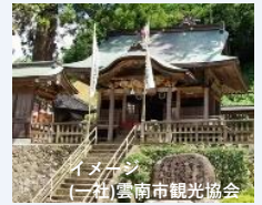
スサノオノミコトがイナタヒメと 築いた新居とされ「日本初之宮」 として知られています

集合場所 出雲：出雲市駅・木次：木次小学校隣接公共駐車場 ※集合場所の詳細は最終案内書面でご確認をお願いいたします。