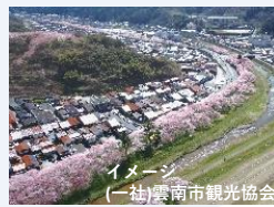
イメージ (一社)雲南市観光協会