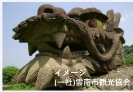
イメージ (一社)雲南市観光協会 ヤマタノオロチ神話の 始まりの場所とされています