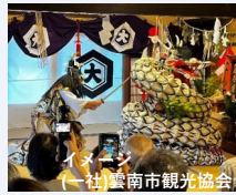
イメージ (一社)雲南市観光協会 大迫力の出雲神楽をご鑑賞