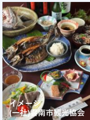
イメージ (一社)雲南市観光協会 このツアーのために作った 特別メニューをお楽しみください

出雲・木次 ●●● 八岐大蛇公園 ●●● 温泉神社 ●●● 天が淵 ●●● 須我神社 9:00発 9:50発 10:00 ----- 11:30 12:00~12:30 ●●● 昼食(曾田屋) ●●● 貸切 神楽鑑賞 ●●● 桜並木・木次まち歩き ●●● 木次・出雲 12:30~13:30 13:45~14:45 15:15~16:45 16:50着 17:15着 オープントップバス乗車(30分)