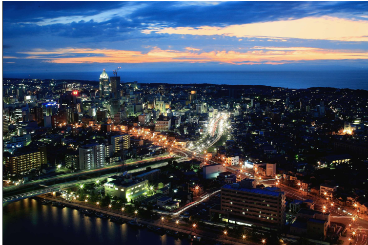
懇親会会場からの夜景(イメージ)

信濃川が日本海に注ぐ雄大な景色を地上 125m から眺めながら、お食事をお楽しみ下さい。 会場の都合上、先着 180 名で締切とさせていただきます。