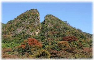
相川金銀山（イメージ）