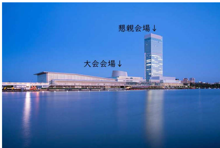
朱鷺メッセおよびホテル日航新潟(イメージ)