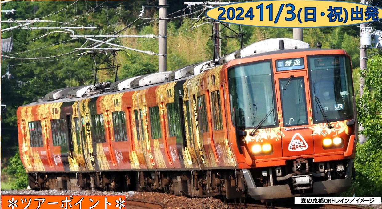
森の京都QRトレイン/イメージ