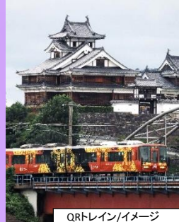
QRトレイン/イメージ