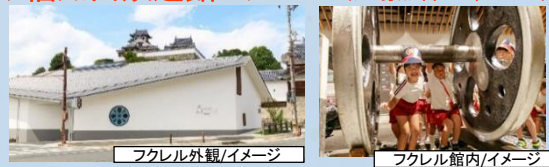
フクレル外観/イメージ