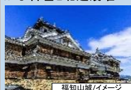
福知山城/イメージ

丹波を平定した明智光秀が城と城下町 を築きました。築城当時から残る個性豊 かな石垣と北近畿唯一の天守が魅力。