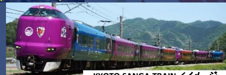
KYOTO SANGA TRAIN/イメージ