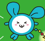
sola旅クラブキャラクター そらたん

最新のsola旅クラブ情報はもちろん ロケットの打上げ情報などを スマホにお届けするベガ★