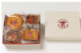
スイーツBOX (イメージ)

下関駅弁が製造していたふく寿司のレシピを忠実の再現し、山口名物ふぐを使用した名物復刻駅弁積み込み