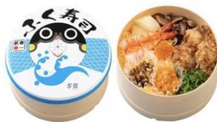
ふく寿司駅弁 (イメージ)

下関駅弁が製造していたふく寿司のレシピを忠実の再現し、山口名物ふぐを使用した名物復刻駅弁積み込み