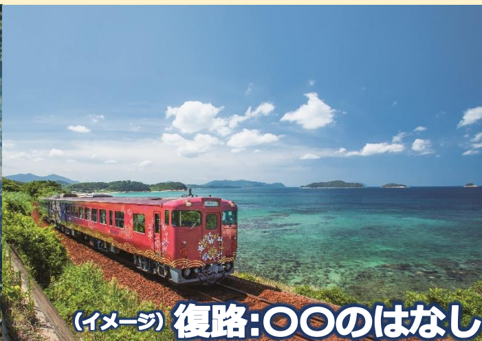
(イメージ) 復路:OOのはなし