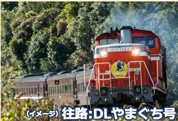
(イメージ) 往路:DLやまぐち号