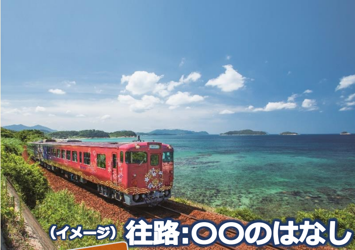
(イメージ) 往路:〇〇のはなし