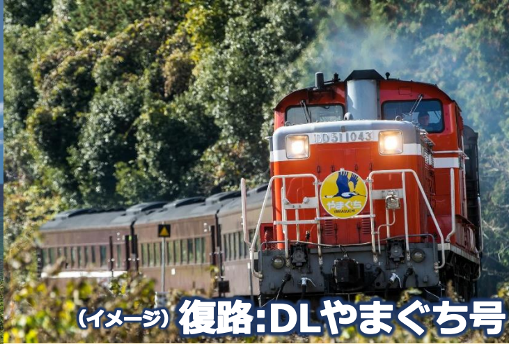
(イメージ) 復路:DLやまぐち号