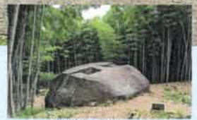
益田岩船 (イメージ)