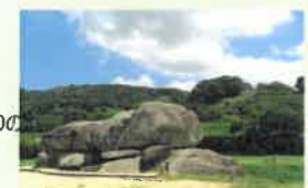
石舞台古墳 (イメージ)