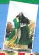
新沢千塚古墳群公園 (イメージ)

【最少催行人員】15名(定員40名)【添乗員】：全行程同行致します。【申込締切】各出発日15日前 【ご旅行代金に含まれるもの】JR・貸切バス代金・宿泊料金・行程表記載の観光、食事代・添乗員費用