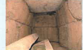
小谷古墳 (イメージ)