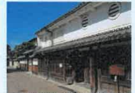
橿原今井町の町並み (イメージ)