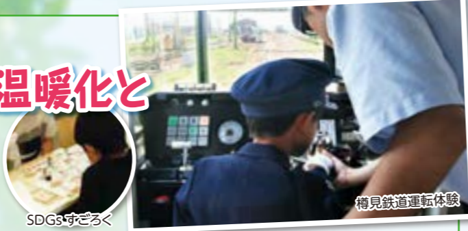
樽見鉄道運転体験