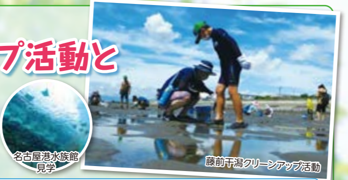
藤前干潟クリーンアップ活動