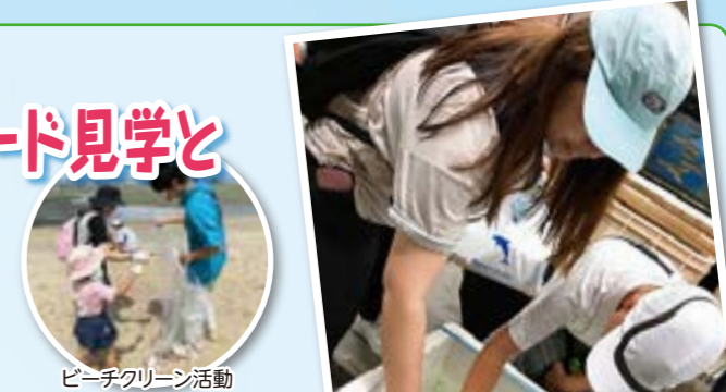
ビーチクリーン活動