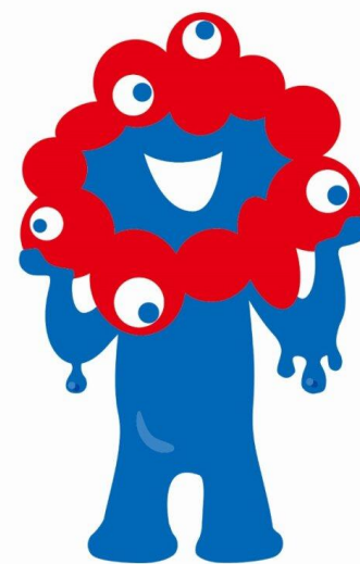
公式キャラクター ミヤクミヤク