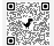
※申し込みサイトはコチラ