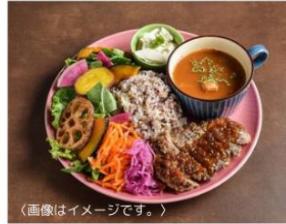
〈画像はイメージです。〉