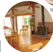
星空ペンションコメット (レストラン)