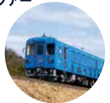
井原鉄道 スタートレイン