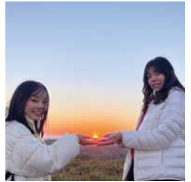
星空ペンションコメットの庭 ※星空ペンションコメットに宿泊の場合のみ