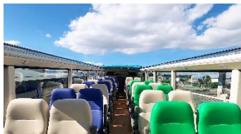
なにわワンダー車内イメージ