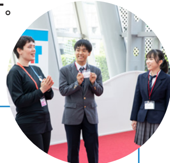
東京グローバルゲートウェイでの研修イメージ