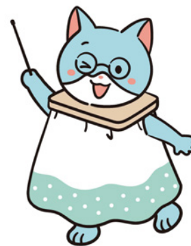
富士市シティプロモーション大使 さもにゃん

台場IC — 東京IC — 海老名SA — 富士IC — 富士市役所 17:30 到着