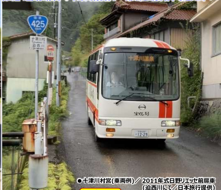
●十津川村営(車両例)/2011年式日野リエッセ前扉車 (迫西川にて)