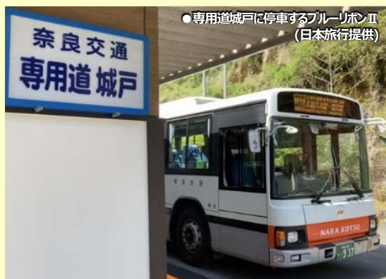
●専用道城戸に停車するブルーリボンII