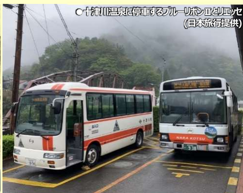
●十津川温泉に停車するブルーリボンIIとリエッセ