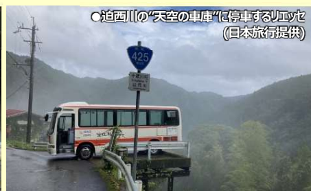
●迫西川の「天空の車庫」に停車するリエッセ