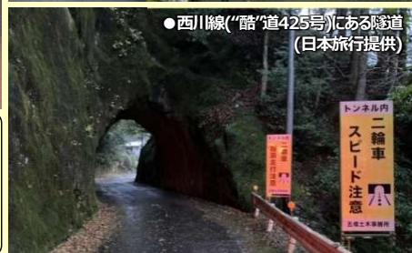
●西川線(「酷」道425号)にある隧道

◆奈良交通 大仏新宮線・八木新宮線 大仏新宮線は1963年に開業した紀伊半島を縦断する一般バス路線で、現在の日本最長一般バス路線である八木新宮線の前身となる路線です。経路は十津川温泉経由の他に北山峡経由も設定されていましたが、区間短縮を重ね1996年に特急バスとしては運行を終了しました。