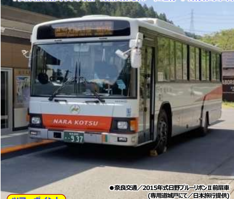
●奈良交通/2015年式日野ブルーリボンII前扉車 (専用道城戸にて/日本旅行提供)

◆長距離路線車貸切で旧・現新宮線をトレース運行 ◆現行線では車内放送・運賃表稼働 ◆十津川村営ツアー用の定期便増車で迫西川へ