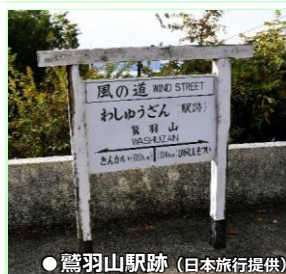
● 鷺羽山駅跡