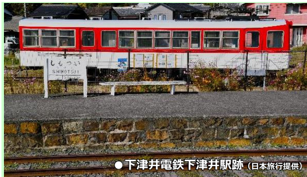
● 下津井電鉄下津井駅跡