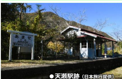
● 天瀬駅跡