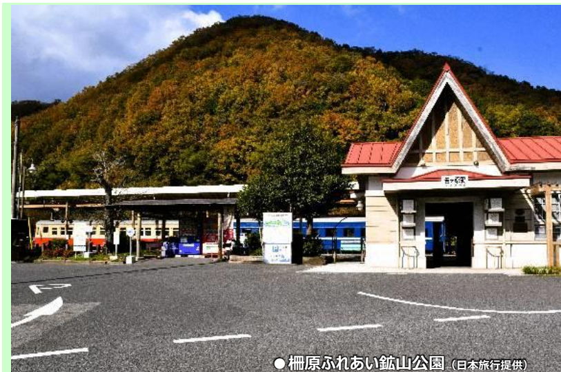
● 柵原ふれあい鉱山公園