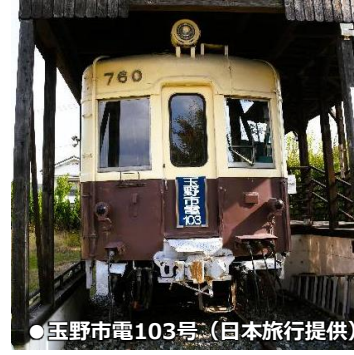
●玉野市電103号