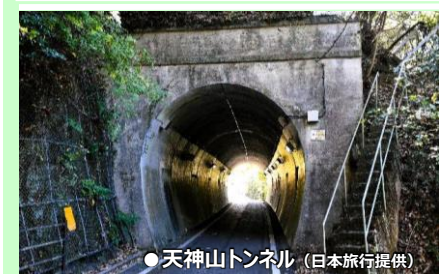
● 天神山トンネル