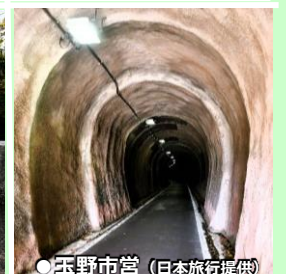
● 玉野市営 (日本旅行提供)