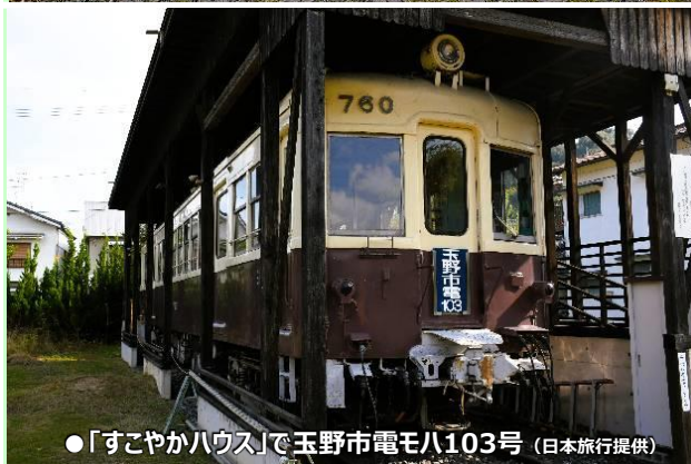
● 「すこやかハウス」で玉野市電モハ103号