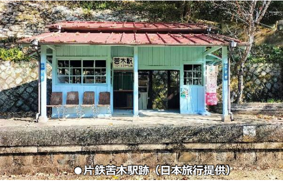
●片鉄吉木駅跡