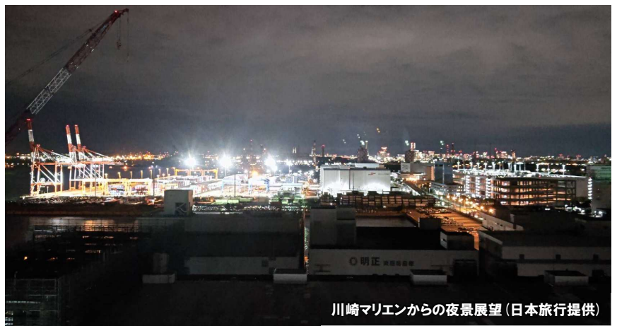
川崎マリエンからの夜景展望