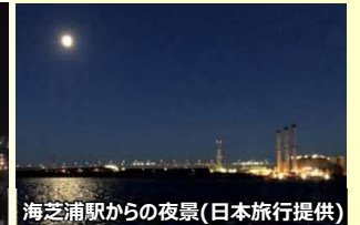
海芝浦駅からの夜景