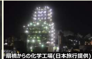
扇橋からの化学工場