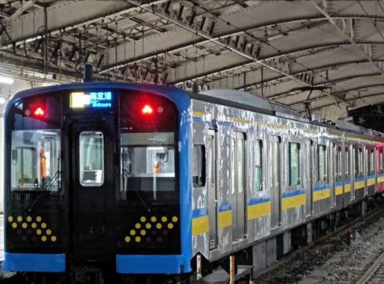
鶴見線E131系電車 ※鶴見線は定期列車利用となります

~臨海工業地帯を走る鶴見線で行く真下が海海芝浦駅からの港湾夜景や、川崎市バス貸切運行で行く川崎工場夜景を夜景ナビゲーターがご案内~