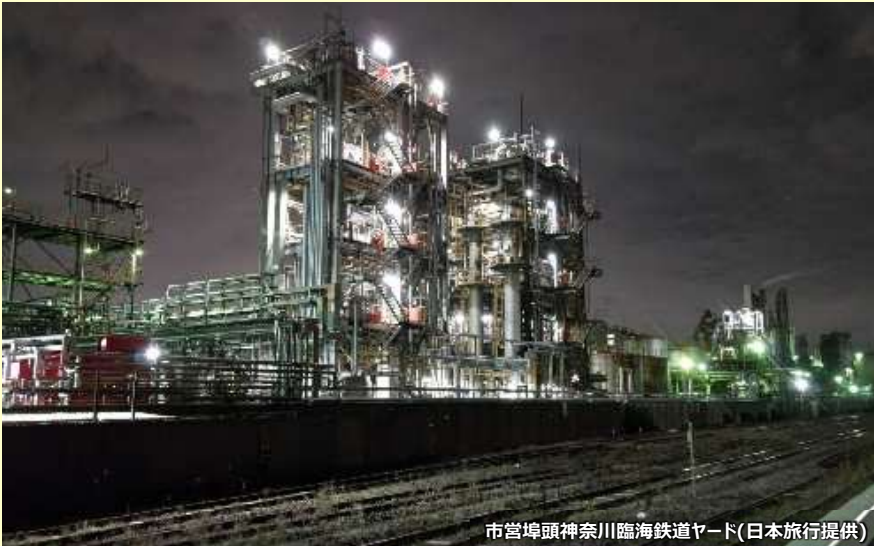
市営埠頭神奈川臨海鉄道ヤード

※この行程表は2024年10月16日現在のものです。今後発着時刻に変更が生じる場合があります。確定時刻は最終ご案内書面でご案内します。