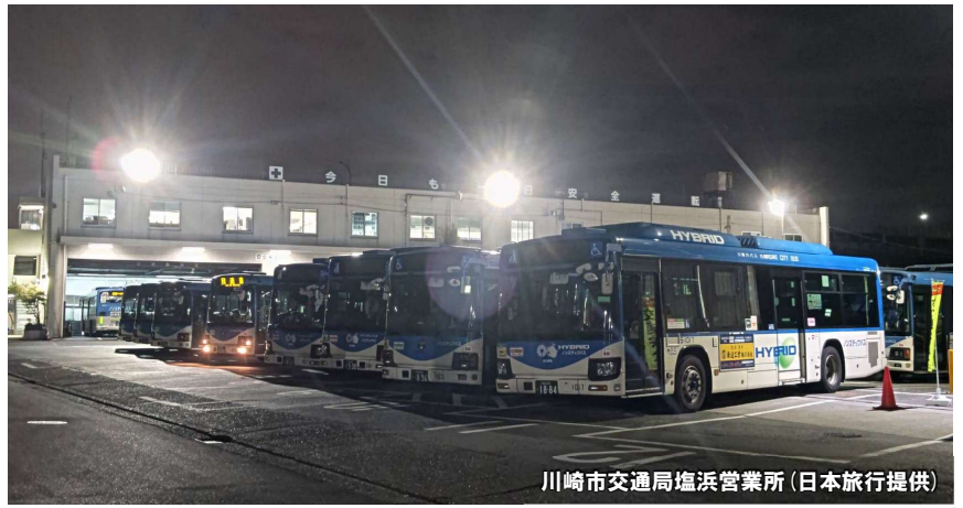
川崎市交通局塩浜営業所