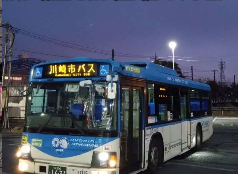
川崎市バス車両の一例 2016年式/いすゞ QSG-LV234L3(ハイブリッド ノンステップ AMT車)