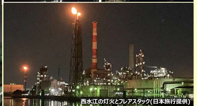
西水江の灯火とフレアスタック