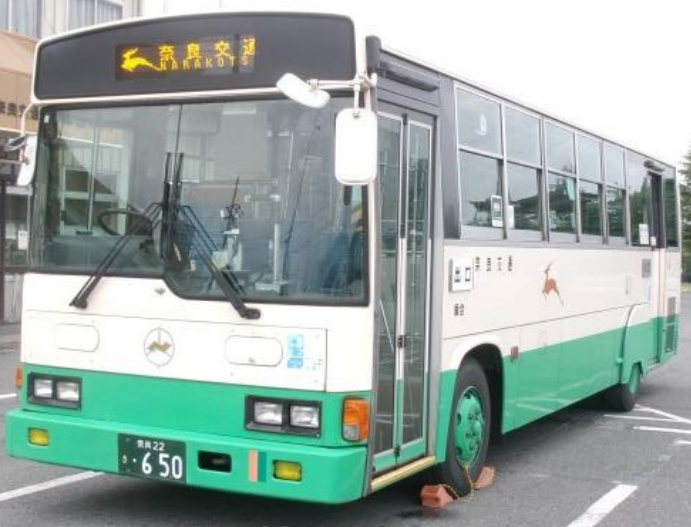
<奈良交通/八木新宮線車両> 1998年式日野レイボー-RJ前後扉路線車KC-RR1JJAA

～日本最長一般バス路線八木新宮線、日本三大酷道425号西川線と村道を分け入る内原線乗車、旧五新線専用道城戸も立寄り～