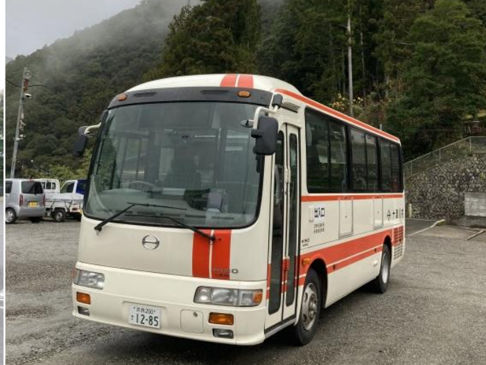
<十津川村営/西川線車両例> 2011年式日野リエッゼ前扉路線車BDG-RX6JFBA