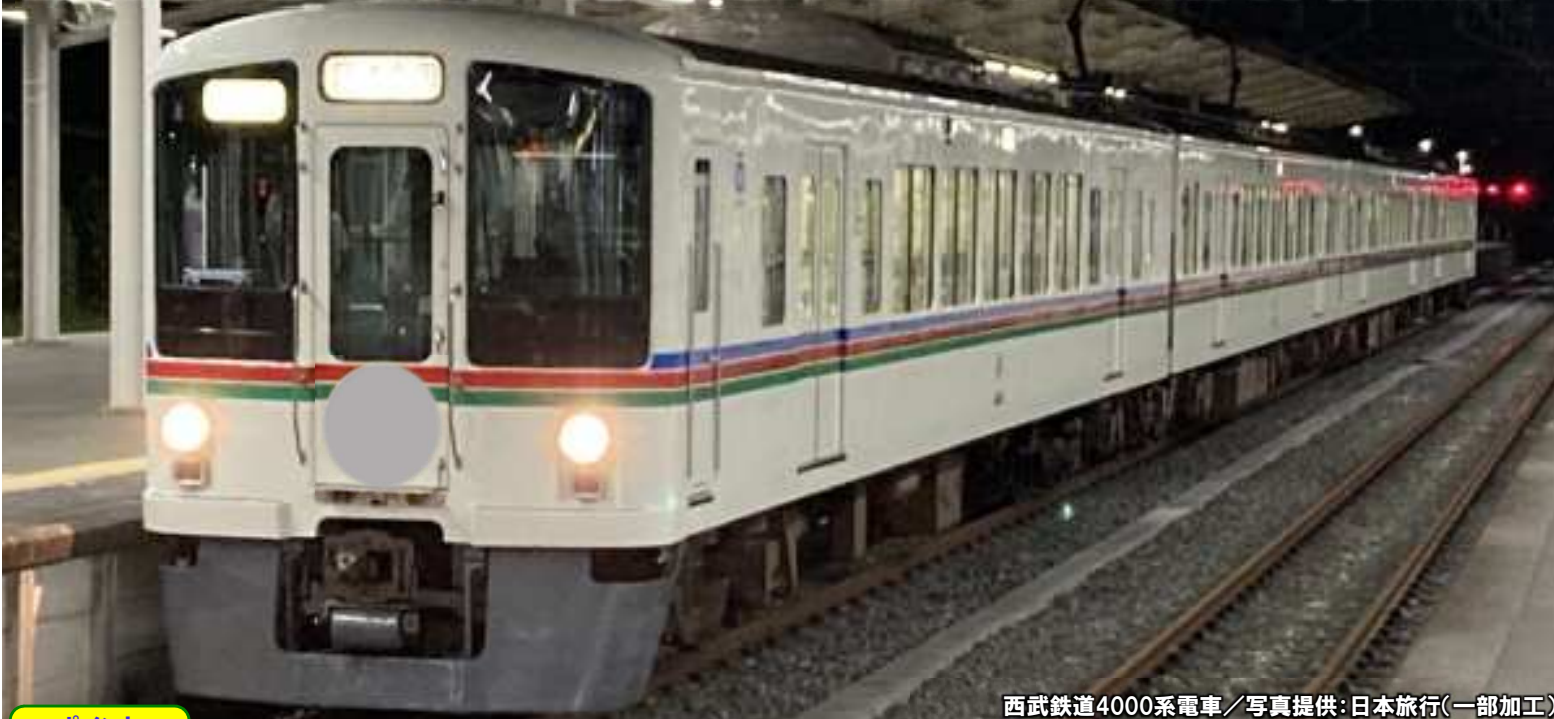
西武鉄道4000系電車/写真提供:日本旅行(一部加工)