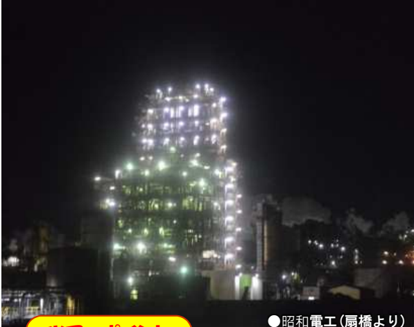
●昭和電工(扇橋より)