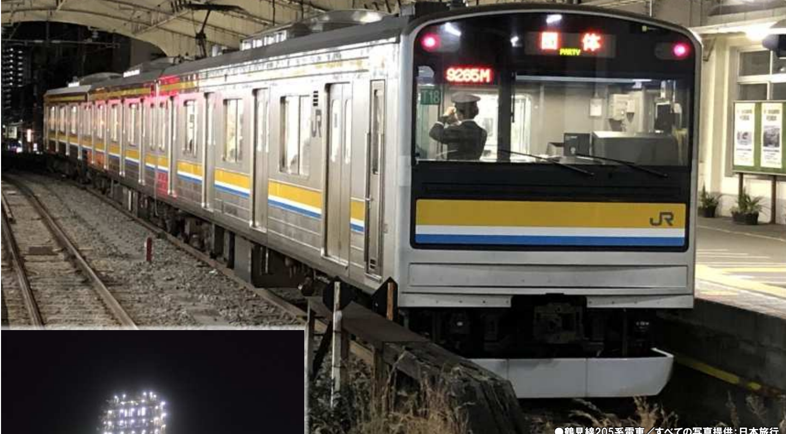
●鶴見線205系電車

～休日は3本のみの大川駅、海芝浦支線では薄暮から闇夜に移り行く港湾夜景のパノラマ、扇町では暗闇に映える工場夜景を鑑賞～