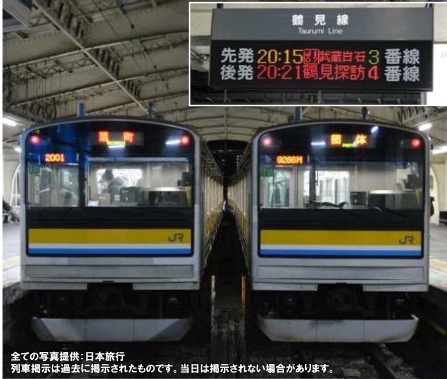
列車掲示は過去に掲示されたものです。当日は掲示されない場合があります。