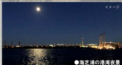
●海芝浦の港湾夜景