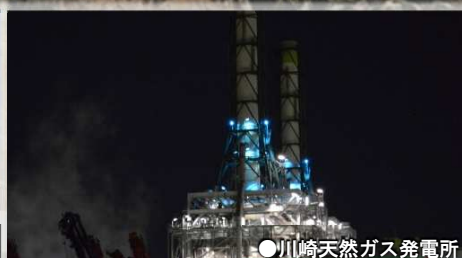
●川崎天然ガス発電所