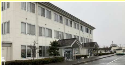
●奈良交通奈良営業所