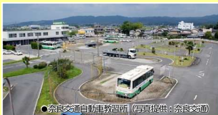
●奈良交通自動車教習所

●当行程表は2023年 6月 2日現在の資料を元に作成したものです。確定時刻は最終のご案内書面でご案内します。 ●道路事情等により遅延する場合があります。