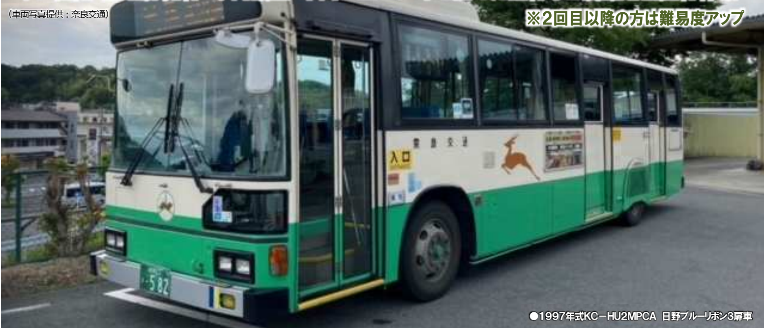
●1997年式KC-HU2MPCA 日野ブルーリボン3扉車