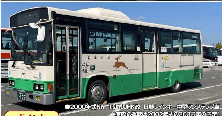
●2000年式KK-RJ1UJHK改 日野レインボー-中型ワンステップ車 (実際の運転は2002年式の203号車の予定)