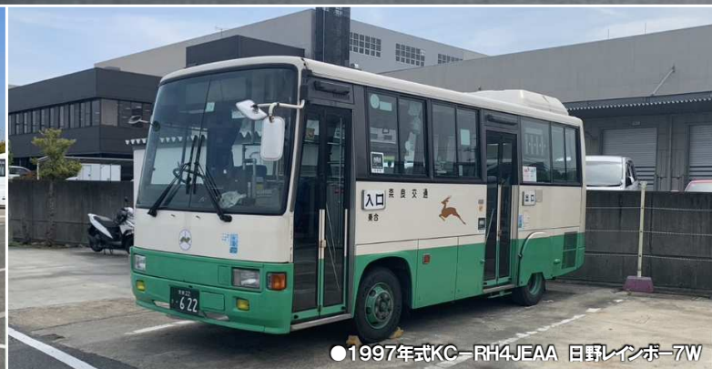
●1997年式KC-RH4JEAA 日野レインボー-7W