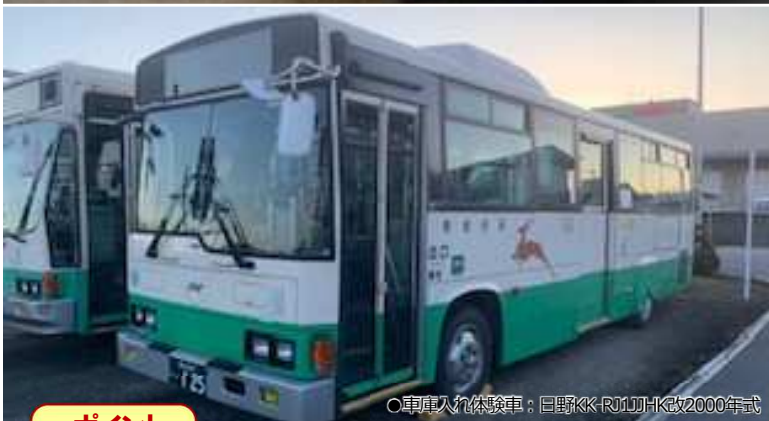
○車庫入れ体験車: 日野KK-RJ1JJK改2000年式