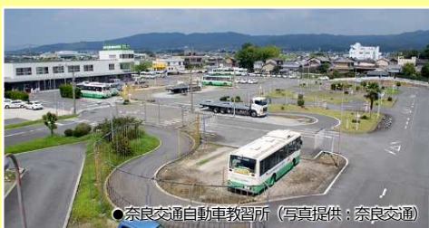
●奈良交通自動車教習所

●当行程表は2023年 2月 1日現在の資料を元に作成したものです。確定時刻は最終のご案内書面でご案内します。●道路事情等により遅延する場合があります。