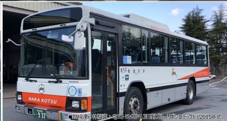
●路線運行体験車: QDG-KV234L3日野ブルーリボンIIトッポア2015年式