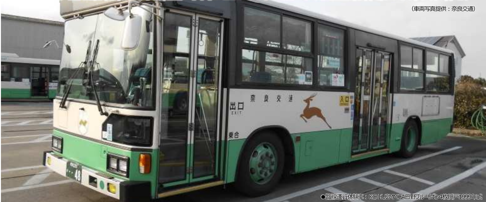
●路線運行体験車: KC-HU2MMCA日野ブルーリボン4枚折戸1999年式