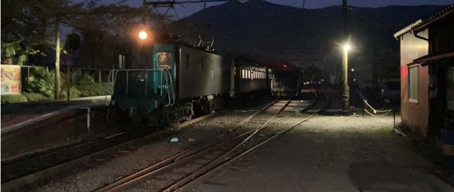
E10牽引列車