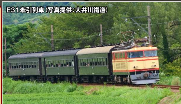
E31牽引列車