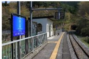
◆恋し浜駅：ホームに幸せの鐘が設置され、来駅の記念に地元「恋し浜ホテル」の貝殻を絵馬にして願掛けできる。