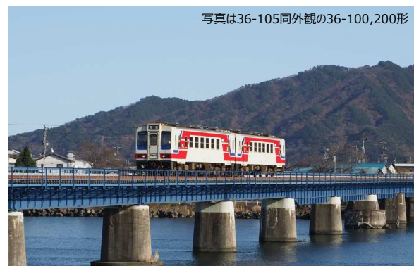
写真は36-105号車外観の36-100,200形