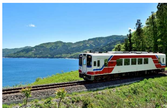
座席図イラスト・車両写真・駅写真提供：三陸鉄道株式会社