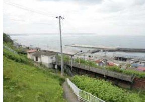
◆堀内駅：太平洋を見渡す高台に位置するホームが1面のみの無人駅。駅から太平洋が一望できる。