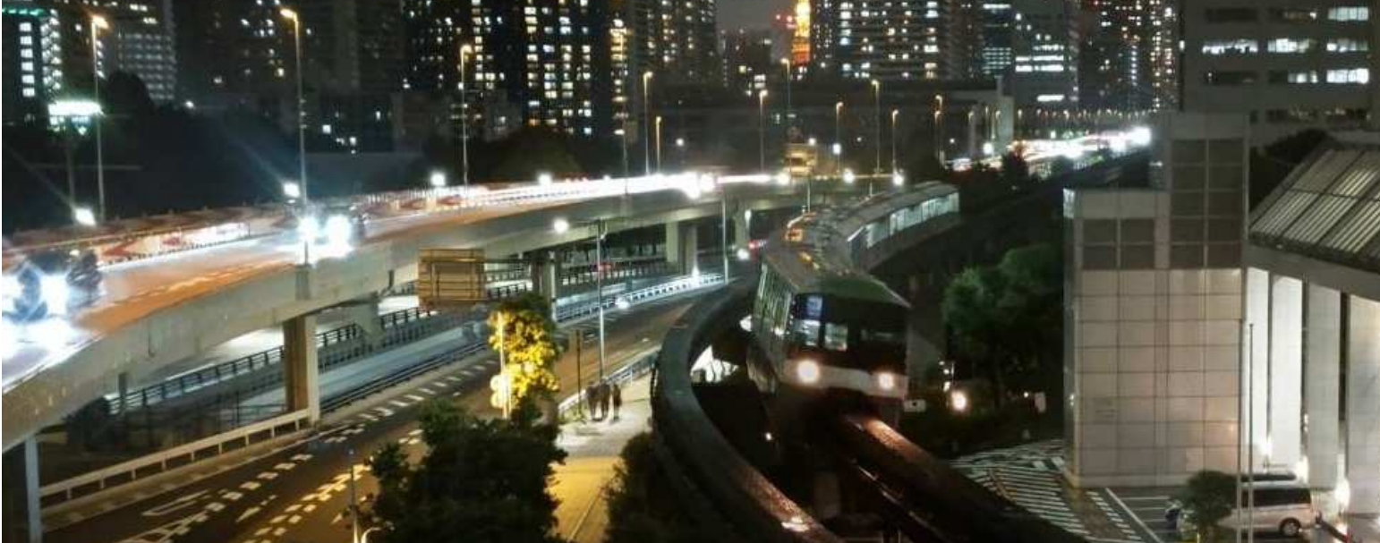
■夜の天王洲付近を走行する東京モノレール(写真提供:日本旅行)

(天候等により星空鑑賞ができない場合は星ソムリエ®指導による星座作図体験を行います)