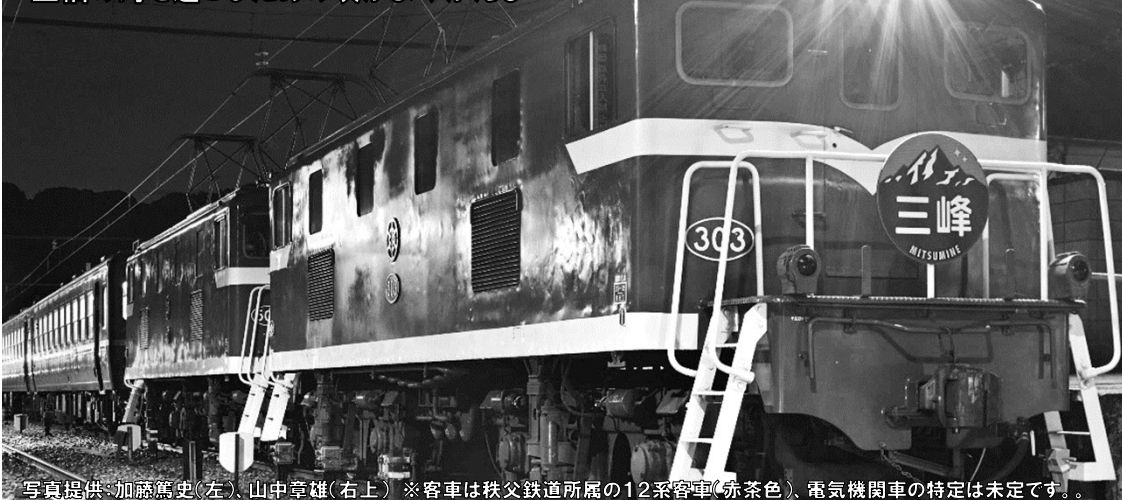
※客車は秩父鉄道所属の12系客車(赤茶色)、電気機関車の特定は未定です。

ハイケンスのセレナーテを耳に過ぎ行く駅名標を眺めるとき、至福の時を過ごしたあの頃がよみがえる