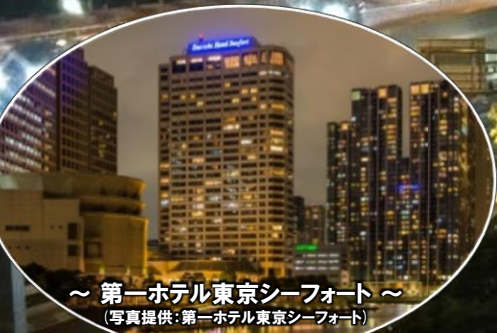
～ 第一ホテル東京シーフォート～