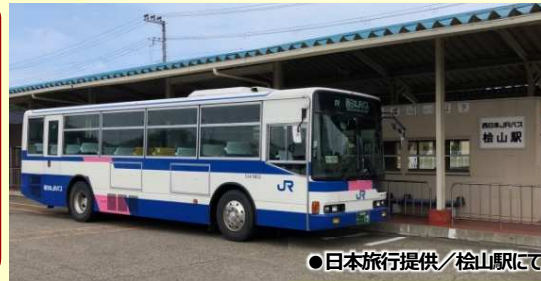
●桧山駅にて