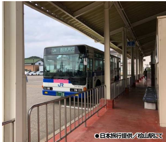
●松山駅にて