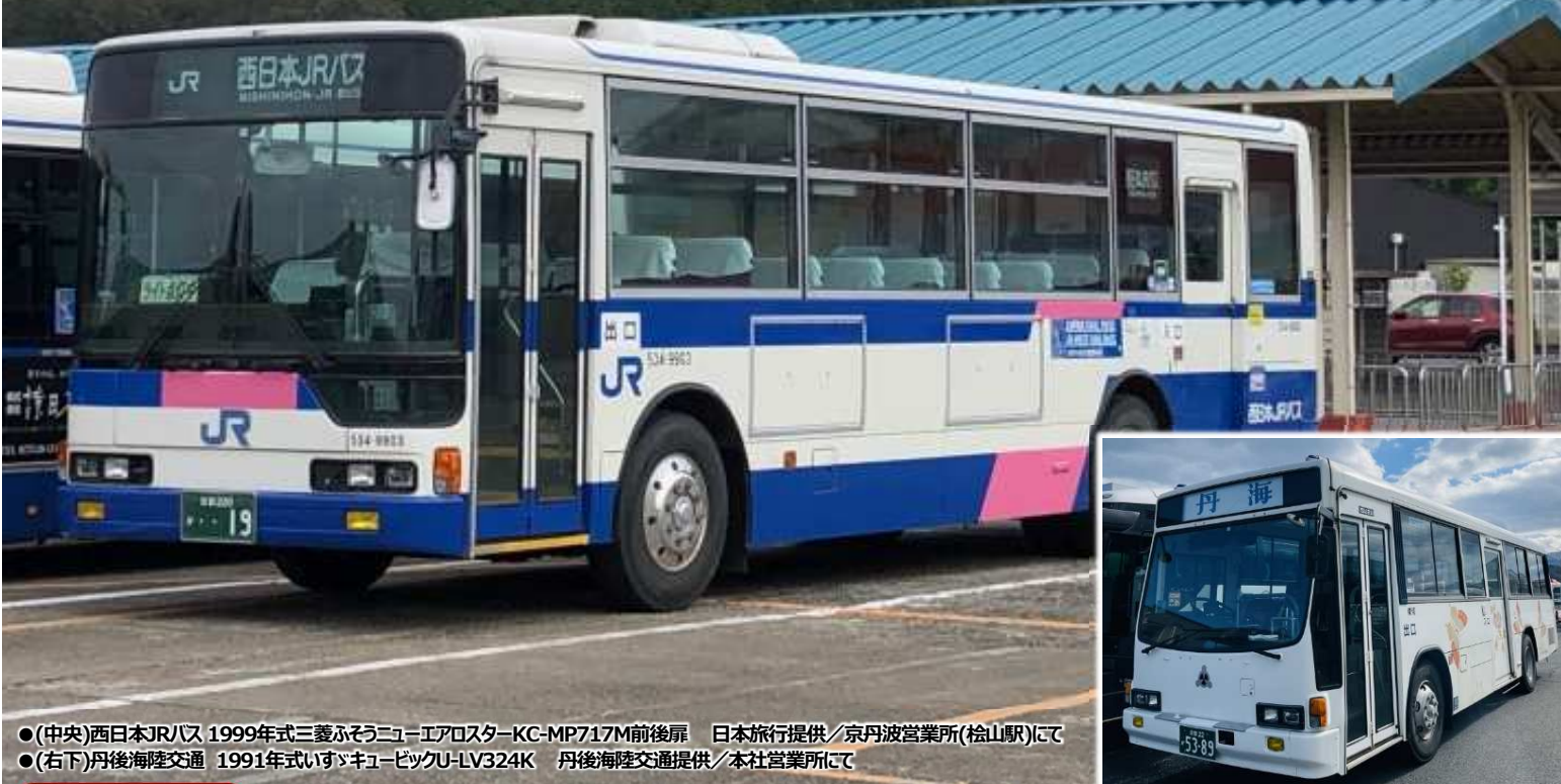
●(中央)西日本JRバス 1999年式三菱ふそうニューエアロスター-KC-MP717M前後扉京丹波営業所(桧山駅)にて ●(右下)丹後海陸交通 1991年式いすゞキュービックU-LV324K本社営業所にて

西日本JRバス園福線のトレース運行・フォトランと 定期便撮影 、京丹波営業所・京都営業所撮影会 丹後海陸交通いすゞキュービック乗車・フォトランと 本社営業所撮影会 ※いすゞキュービックが廃車になるわけではありません