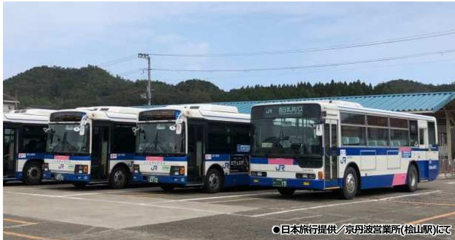
●京丹波営業所(松山駅)にて