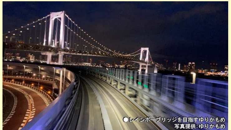
●レインボーブリッジを目指すゆりかもめ