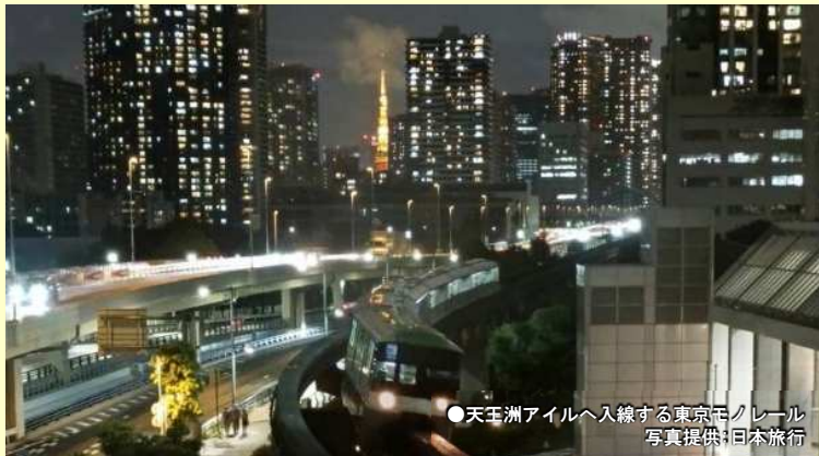
●天王洲アイルへ入線する東京モノレール